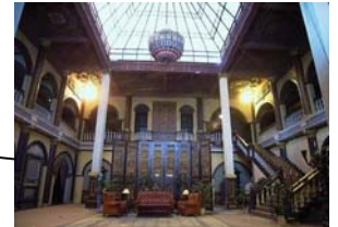
馬降龍 - 4