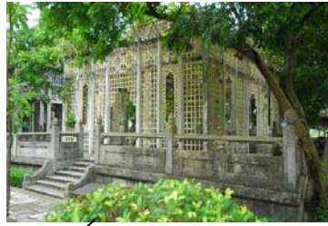
立園 - 3