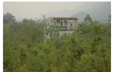
馬降龍 - 5