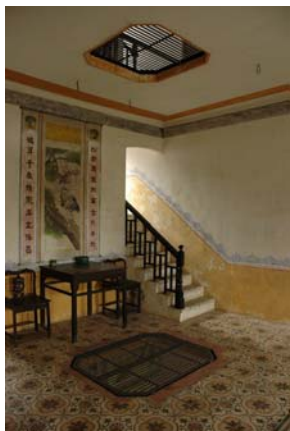
馬降龍 - 1