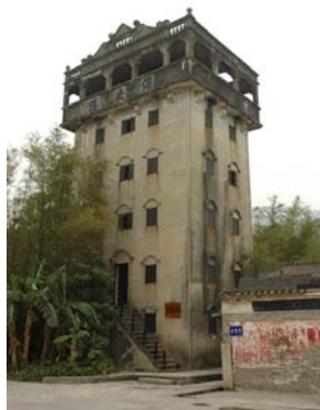
馬降龍 - 2