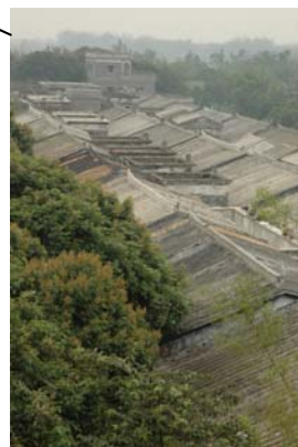
馬降龍 - 3