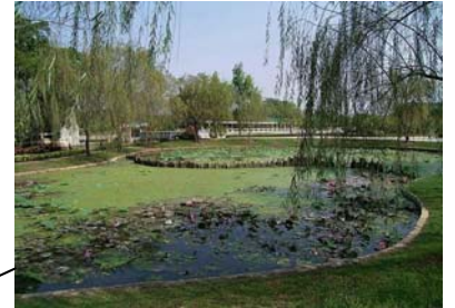
立園 - 4