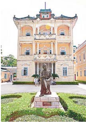
立園 - 1