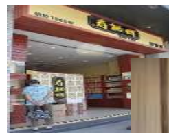
壽桃牌麵食展覽館