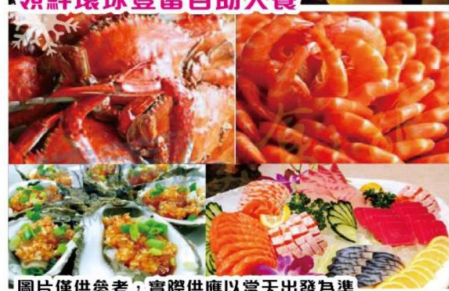
圖片僅供參考，實際供應以當天出發為準