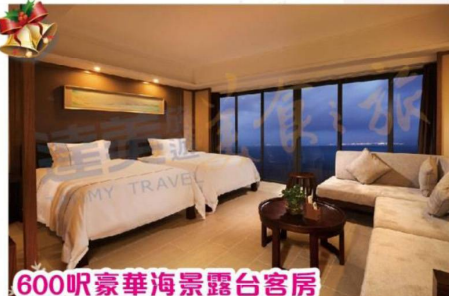
600呎豪華海景露台客房