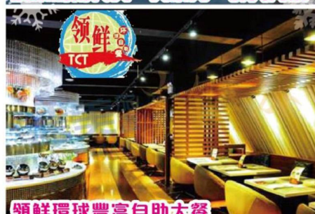
領鮮環球豐富自助大餐