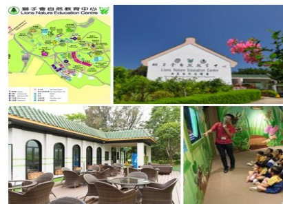
行程及圖片祇供參考